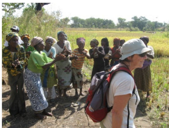
Dans la rizière

La revente de récoltes en fonction du marché est d'un bon rapport, par exemple le maïs peut doubler sa valeur en fonction de la saison. Une bonne gestion doit permettre de dégager un bénéfice conséquent.